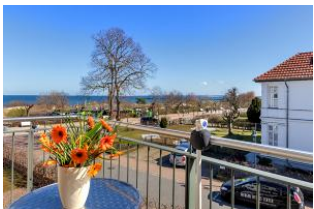
Balkon mit Ausblick