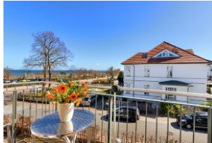
Balkon mit Ausblick