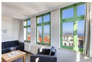
Wohnen / Seeblick aus der Veranda