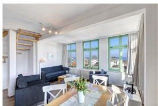
Wohnen / Essen / Aufgang

STRANDNAH mit SEEBLICK und BALKON! Nur ca. 100 m zur Strandpromenade! FAHRSTUHL im Haus. Schönes großes Maisonette-Apartment mit 4 Zimmern auf zwei Ebenen, gute Ausstattung. 3 Schlafzimmer, Wohnzimmer mit vollwertiger Küchenzeile und Essplatz, Duschbad (untere Ebene), Wannenbad (obere Ebene), zus. Gäste-WC, Eingangsflur, Balkon. Die Wohnung verfügt über einen Pkw-Stellplatz. Seeblick über die vorstehenden Häuser hinweg. Abstellraum für Fahrräder und ähnliches ist vorhanden. Vom Haus aus können Sie das Ortszentrum und die bekannte Ahlbecker Seebrücke in ca. 3 bzw. 5 Minuten zu Fuß erreichen.