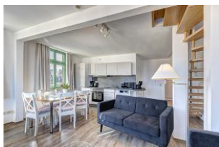
Wohnen / Essen / Küche