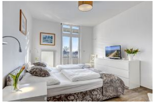
Schlafzimmer mit Zugang zum Balkon