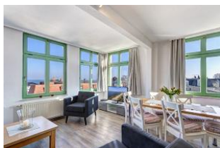
Wohnen / Essen