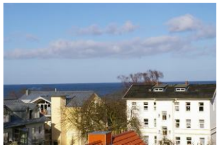
Seeblick Ostseewarte Nr. 17