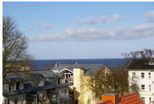
Seeblick aus der Veranda Ostseewarte Nr. 14