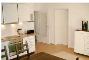
Gut ausgestattete Küche mit großem Essplatz

Strandnah mit SÜDTERRASSE, Balkon und KAMINOFEN! Großzügige und gut ausgestattete 3-Zimmer-Wohnung mit zwei separaten Schlafzimmern, großer Küche mit Eßplatz, Wohn-/Schlafzimmer mit Kaminofen und 140 cm Schlafcouch für die 5. Person, Bad mit Wanne und Dusche, zusätzliches Duschbad, Eingangsflur. Die Wohnung hat einen separaten Eingang. Vom Haus aus können Sie das Ortszentrum und die bekannte Ahlbecker Seebrücke in ca. 3 Minuten zu Fuß erreichen. Zum Strand sind es ca. 80 m Luftlinie. Für Brennholz muß - wenn Kaminofennutzung gewünscht ist - selbst gesorgt werden (im nahegelegenen Supermarkt oder bei uns erhältlich). Diese Wohnung verfügt nicht über WLAN.