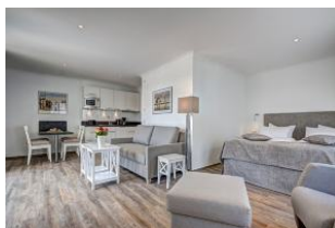
Blick zum Bett und zur Couch