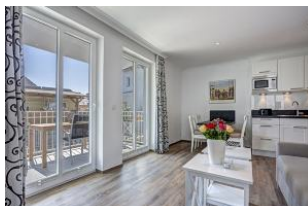
Blick zum Balkon