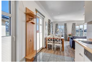
Küchenzeile mit Blick zum Essplatz