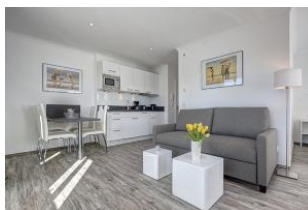
Essplatz und Küchenzeile