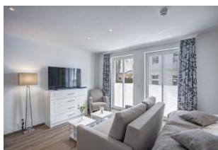
Flachbild TV und Couch