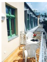
Großer Süd - Balkon