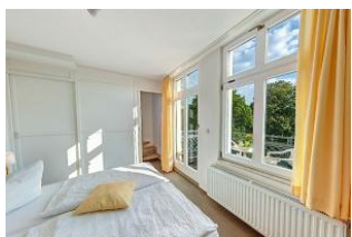
Wohnbereich, Blick in das Schlafzimmer mit Empore

STRANDNAH mit SÜDBALKON! Nur ca. 100 m zur Strandpromenade! Schönes gemütliches Maisonette-Apartment mit 2 Zimmern und zus. Schlafrum auf der Empore, gute Ausstattung. Separates Schlafzimmer, zus. Maisonette-Schlafrum, Wohnzimmer mit Küchenzeile und Essplatz, Duschbad, Südbalkon. Die Wohnung verfügt über einen Pkw-Stellplatz. Abstellraum für Fahrräder und ähnliches ist vorhanden. Eine Sauna in der "Villa Germania" kann kostenpflichtig genutzt werden. Vom Haus aus können Sie das Ortszentrum und die bekannte Ahlbecker Seebücke in ca. 3 bzw. 5 Minuten zu Fuß erreichen.