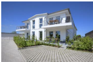
Hausansicht Neubau Villa Margarete