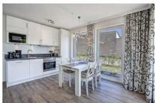
Essplatz und Küche