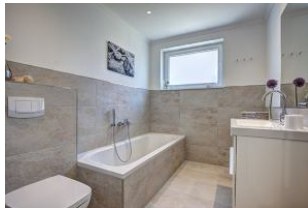
Bad mit Badewanne