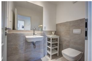
separates Gäste WC