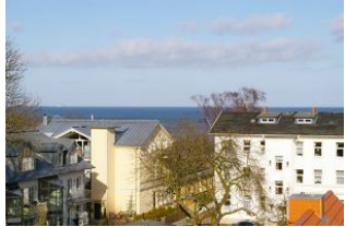
Seeblick vom Balkon