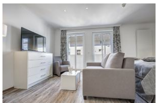
Couch und Flachbild TV