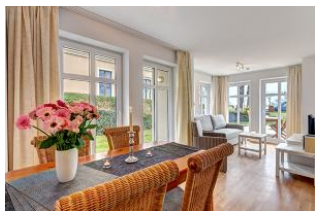
Essplatz und Blick in den Wohnbereich und zur Terrasse

1. Reihe, direkt an der Strandpromenade mit TERRASSE zur Seeseite! FAHRSTUHL im Haus! Schönes 3-Zimmer-Apartment mit moderner guter Ausstattung. Zwei separate Schlafzimmer, Wohnzimmer mit Essplatz, Küchenbereich, Duschbad, Gäste-WC, Terrasse zur Promenadenseite, zus. kleine Terrasse neben dem Eßplatz. Die Wohnung verfügt über einen Tiefgaragen-Pkw-Stellplatz. In der Garage können auch Fahrräder und ähnliches untergestellt werden. In unserer "Villa Germania" nebenan gibt es eine Sauna. Von der "Villa Aquamarina" aus können Sie das Ortszentrum und die bekannte Ahlbecker Seebrücke in ca. 3 Minuten zu Fuß erreichen. Zum Strand sind es 50 m.