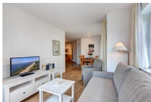
Wohnbereich mit Blick zum Essplatz