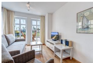
Wohnbereich mit Blick zur Terrasse