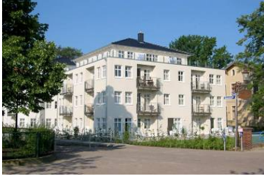
Hausansicht "Villa Aquamarina" von der Promenade