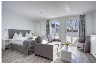
Bett und Couch

Schönes geräumiges Zimmer (incl. Frühstücksbuffett) im 2. OG für 2 Personen mit Balkon nach Osten! STRANDNAH! Hochwertig und modern eingerichtet, mit einem geräumigen Duschbad, schönem Essplatz und einer Küchenzeile ausgestattet. Die bekannte Ahlbecker Seebrücke erreichen Sie in ca. 3 Minuten zu Fuß. Zur Strandpromenade sind es nur 100m. Fahrräder können in der Tiefgarage untergestellt werden. Ihr Frühstück nehmen Sie im Frühstücksraum und - bei gutem Wetter - auf unserer schönen Sonnenterrasse ein, wenn Sie mögen!