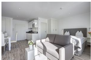
Bett und Couch