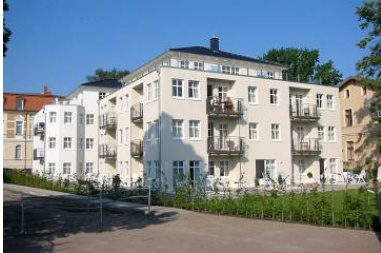
Architekturansicht "Villa Aquamarina" von der Promenade