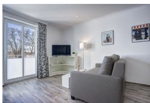
TV und Couch