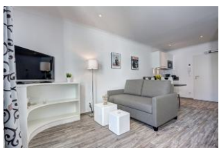
TV und Couch