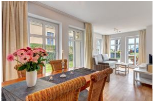
Essplatz und Blick in den Wohnbereich und zur Terrasse

1. Reihe, direkt an der Strandpromenade mit TERRASSE zur Seeseite! FAHRSTUHL im Haus! Schönes 3-Zimmer-Apartment mit moderner guter Ausstattung. Zwei separate Schlafzimmer, Wohnzimmer mit Essplatz, Küchenbereich, Duschbad, Gäste-WC, Terrasse zur Promenadenseite, zus. kleine Terrasse neben dem Eßplatz. Die Wohnung verfügt über einen Tiefgaragen-Pkw-Stellplatz. In der Garage können auch Fahrräder und ähnliches untergestellt werden. In unserer "Villa Germania" nebenan gibt es eine Sauna. Von der "Villa Aquamarina" aus können Sie das Ortszentrum und die bekannte Ahlbecker Seebrücke in ca. 3 Minuten zu Fuß erreichen. Zum Strand sind es 50 m.