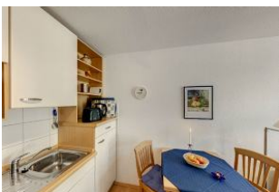
Küche mit Esszimmer