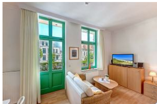
Kombinierter Wohn- / Schlafraum

STRANDNAH! Nur ca. 100 m zur Strandpromenade mit BALKON! Gemütliches 1-Zimmer-Apartment mit guter Ausstattung. Geräumiger Wohn-/Schlafraum mit Doppelbett und Sitz-/Sofaecke, Küchenzeile mit Essplatz, Duschbad, kleiner Vorflur, Balkon. Die Wohnung verfügt über einen Pkw-Stellplatz. Abstellraum für Fahrräder und ähnliches ist vorhanden. Eine Sauna in der "Villa Germania" kann kostenpflichtig genutzt werden. Vom Haus aus können Sie das Ortszentrum und die bekannte Ahlbecker Seebücke in ca. 3 bzw. 5 Minuten zu Fuß erreichen.