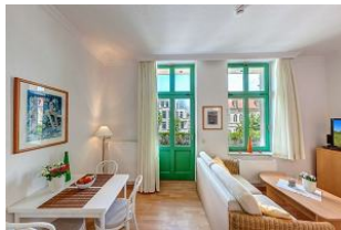
Küchenzeile und Eßplatz