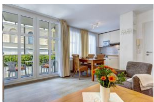
Wohnen, Essen, Küche, Balkon

Direkt an der Strandpromenade mit SÜDBALKON und FAHRSTUHL im Haus! Schönes geräumiges 2-Zimmer-Apartment mit moderner guter Ausstattung. Separates Schlafzimmer (mit Fernseher), Wohnzimmer mit Küchenzeile und Essplatz, Duschbad, Balkon zur Südseite mit Sonne bis abends. Die Wohnung verfügt über einen Tiefgaragen-Pkw-Stellplatz. In der Garage können auch Fahrräder und ähnliches untergestellt werden. Von der "Villa Aquamarina" aus können Sie das Ortszentrum und die bekannte Ahlbecker Seebrücke in ca. 3 Minuten zu Fuß erreichen. Zum Strand sind es 50 m.