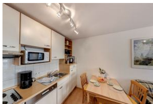
Küche mit Essbereich