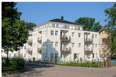
Hausansicht "Villa Aquamarina" von der Promenade