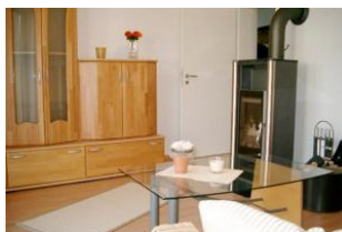
Wohn-/Schlafzimmer mit Kaminofen und Schlafcouch (140 cm) für 5. und (wenn gewünscht) 6. Person