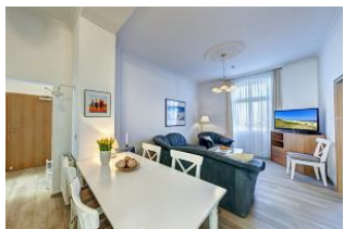
Wohnraum mit direktem Zugang zum Garten und dortiger Terrasse

Direkt an der Strandpromenade mit großem GARTEN und SÜDBALKON! Schönes komfortables 4 - Zimmer - Apartment mit guter und vollwertiger Ausstattung. Drei separate Schlafzimmer, separate Küche, zus. Essplatz im Wohnraum, Duschbad und Gäste-WC, Wohnraum mit direktem Gartenzugang und Terrasse, Südbalkon mit Sonne bis abends. Die Wohnung verfügt über einen Pkw-Stellplatz. In der Garage können Fahrräder und ähnliches untergestellt werden. Im Haus gibt es eine Sauna. Von der "Villa Germania" aus können Sie das Ortszentrum und die bekannte Ahlbecker Seebrücke in ca. 3 Minuten zu Fuß erreichen. Zum Strand sind es 50 m. Von Mai bis September ist ein Strandkorb im Tagespreis enthalten!