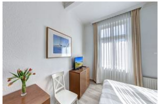
Schlafzimmer 1 mit Zugang zum Balkon