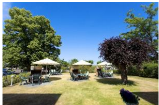
Garten mit Terrassen und Strandkörben (Mai bis September)