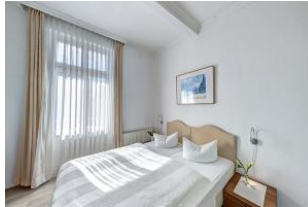
Schlafzimmer 1 mit Zugang zum Balkon