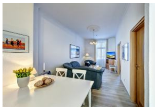
Wohnraum mit direktem Zugang zum Garten und dortiger Terrasse