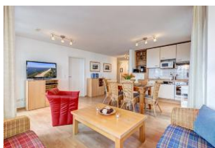
Wohnen und Essen