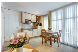
Küche, Wssen, Wohnen

1. Reihe, direkt an der Strandpromenade mit SÜDBALKON! FAHRSTUHL im Haus! Schönes 2-Zimmer-Apartment mit moderner guter Ausstattung. Separates Schlafzimmer (mit Fernseher), Wohnzimmer mit Küchenzeile mit Essplatz, Duschbad, Balkon zur Südseite mit Sonne bis abends. Die Wohnung verfügt über einen Pkw-Stellplatz. In der Garage können auch Fahrräder und ähnliches untergestellt werden. Von der "Villa Aquamarina" aus können Sie das Ortszentrum und die bekannte Ahlbecker Seebrücke in ca. 3 Minuten zu Fuß erreichen. Zum Strand sind es 50 m.