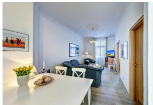
Wohnraum mit direktem Zugang zum Garten und dortiger Terrasse