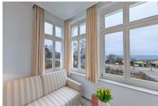
Blick aus Veranda