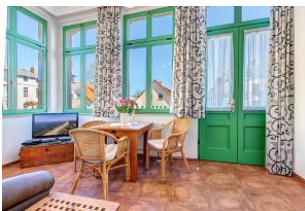
Wohnen und Essen