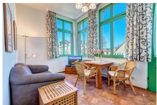
Wohnen und Essen

STRANDNAH! Nur ca. 100 m zur Strandpromenade mit TERRASSE, KLEINEM GARTEN und STRANDKORB! Gemütliches 2-Zimmer-Apartment mit freundlicher Ausstattung. Separates Schlafzimmer, Wohnzimmer mit Schlafcouch, Küchenzeile, Essplatz, geräumiges Duschbad, Terrasse mit Gartenmöbeln und STRANDKORB (Frühling bis Herbst) und kleinem Gartenstück, separater Eingang. Die Wohnung verfügt über einen Pkw-Stellplatz . Abstellraum für Fahrräder und ähnliches ist vorhanden. Eine Sauna in der "Villa Germania" kann kostenpflichtig genutzt werden. Vom Haus aus können Sie das Ortszentrum und die bekannte Ahlbecker Seebrücke in ca. 3 bzw. 5 Minuten zu Fuß erreichen.