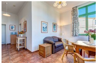
Wohnen und Essen