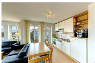
Küche mit Essbereich