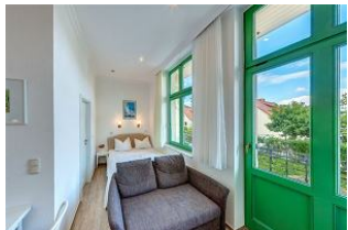
Kombinierter Wohn- / Schlafraum

STRANDNAH! Nur ca. 100 m zur Strandpromenade mit BALKON! Gemütliches 1-Zimmer-Apartment mit guter Ausstattung. Wohn-/Schlafraum mit Doppelbett und Sitz-/Sofaecke, Küchenzeile mit Essplatz, kleines Duschbad mit großer walk-in-Dusche, Balkon. Die Wohnung verfügt über einen Pkw-Stellplatz. Abstellraum für Fahrräder und ähnliches ist vorhanden. Eine Sauna in der "Villa Germania" kann kostenpflichtig genutzt werden. Vom Haus aus können Sie das Ortszentrum und die bekannte Ahlbecker Seebrücke in ca. 3 bzw. 5 Minuten zu Fuß erreichen.