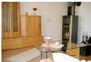
Wohn-/Schlafzimmer mit Kaminofen und Schlafcouch (140 cm) für 5. und (wenn gewünscht) 6. Person