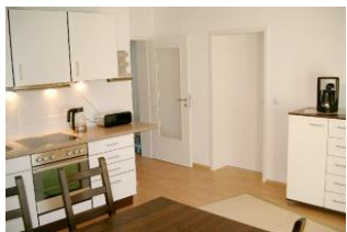
Gut ausgestattete Küche mit großem Essplatz

Strandnah mit SÜDTERRASSE, Balkon und KAMINOFEN! Großzügige und gut ausgestattete 3-Zimmer-Wohnung mit zwei separaten Schlafzimmern, großer Küche mit Eßplatz, Wohn-/Schlafzimmer mit Kaminofen und 140 cm Schlafcouch für die 5. Person, Bad mit Wanne und Dusche, zusätzliches Duschbad, Eingangsflur. Die Wohnung hat einen separaten Eingang. Vom Haus aus können Sie das Ortszentrum und die bekannte Ahlbecker Seebücke in ca. 3 Minuten zu Fuß erreichen. Zum Strand sind es ca. 80 m Luftlinie. Für Brennholz muß - wenn Kaminofennutzung gewünscht ist - selbst gesorgt werden (im nahegelegenen Supermarkt oder bei uns erhältlich). Diese Wohnung verfügt nicht über WLAN.