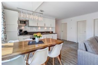
Küche und Essplatz