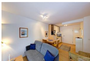
Wohnbereich und Küchenzeile