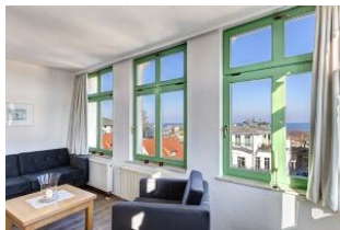
Wohnen / Seeblick aus der Veranda