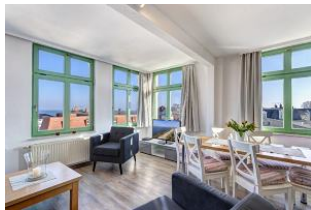
Wohnen / Essen