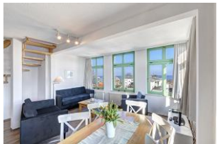
Wohnen / Essen / Aufgang

STRANDNAH mit SEEBLICK und BALKON! Nur ca. 100 m zur Strandpromenade! FAHRSTUHL im Haus. Schönes großes Maisonette-Apartment mit 4 Zimmern auf zwei Ebenen, gute Ausstattung. 3 Schlafzimmer, Wohnzimmer mit vollwertiger Küchenzeile und Essplatz, Duschbad (untere Ebene), Wannenbad (obere Ebene), zus. Gäste-WC, Eingangsflur, Balkon. Die Wohnung verfügt über einen Pkw-Stellplatz. Seeblick über die vorstehenden Häuser hinweg. Abstellraum für Fahrräder und ähnliches ist vorhanden. Vom Haus aus können Sie das Ortszentrum und die bekannte Ahlbecker Seebrücke in ca. 3 bzw. 5 Minuten zu Fuß erreichen.