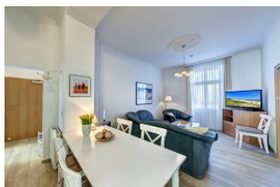
Wohnraum mit direktem Zugang zum Garten und dortiger Terrasse

Direkt an der Strandpromenade mit großem GARTEN und SÜDBALKON! Schönes komfortables 4 - Zimmer - Apartment mit guter und vollwertiger Ausstattung. Drei separate Schlafzimmer, separate Küche, zus. Essplatz im Wohnraum, Duschbad und Gäste-WC, Wohnraum mit direktem Gartenzugang und Terrasse, Südbalkon mit Sonne bis abends. Die Wohnung verfügt über einen Pkw-Stellplatz. In der Garage können Fahrräder und ähnliches untergestellt werden. Im Haus gibt es eine Sauna. Von der "Villa Germania" aus können Sie das Ortszentrum und die bekannte Ahlbecker Seebrücke in ca. 3 Minuten zu Fuß erreichen. Zum Strand sind es 50 m. Von Mai bis September ist ein Strandkorb im Tagespreis enthalten!