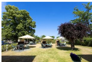
Garten mit Terrassen und Strandkörben (Mai bis September)