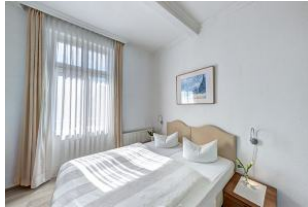
Schlafzimmer 1 mit Zugang zum Balkon