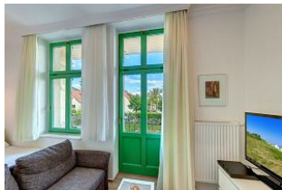
Küchenzeile und Eßplatz