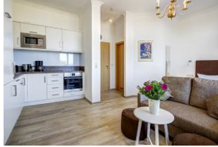
Blick zum Flur und zur Badtür