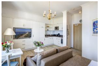
Wohnen, Essen, Küche