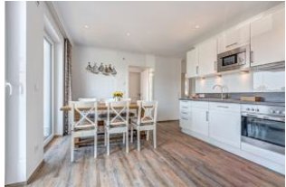
Essplatz und Küche