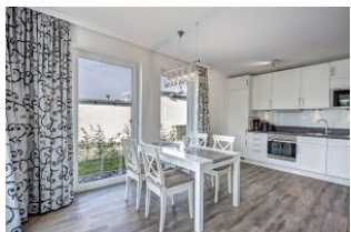
Essplatz und Küche