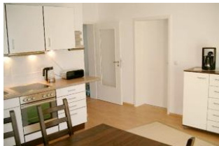
Gut ausgestattete Küche mit großem Essplatz

Strandnah mit SÜDTERRASSE, Balkon und KAMINOFEN! Großzügige und gut ausgestattete 3-Zimmer-Wohnung mit zwei separaten Schlafzimmern, großer Küche mit Eßplatz, Wohn-/Schlafzimmer mit Kaminofen und 140 cm Schlafcouch für die 5. Person, Bad mit Wanne und Dusche, zusätzliches Duschbad, Eingangsflur. Die Wohnung hat einen separaten Eingang. Vom Haus aus können Sie das Ortszentrum und die bekannte Ahlbecker Seebrücke in ca. 3 Minuten zu Fuß erreichen. Zum Strand sind es ca. 80 m Luftlinie. Für Brennholz muß - wenn Kaminofennutzung gewünscht ist - selbst gesorgt werden (im nahegelegenen Supermarkt oder bei uns erhältlich). Diese Wohnung verfügt nicht über WLAN.