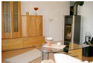
Wohn-/Schlafzimmer mit Kaminofen und Schlafcouch (140 cm) für 5. und (wenn gewünscht) 6. Person