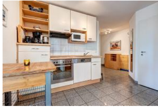
Küchenzeile und Blick in den Eingangsfloor