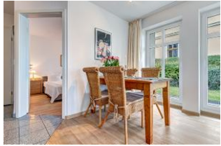
Essplatz und Blick in Schlafzimmer 1