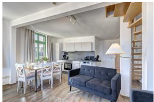
Wohnen / Essen / Küche