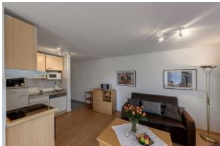
Küche und Wohnbereich