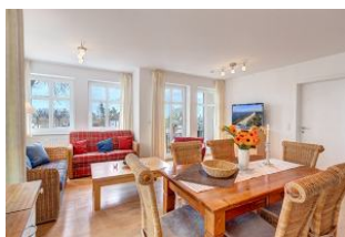
Essplatz und Blick zu Wohnbereich und Balkon