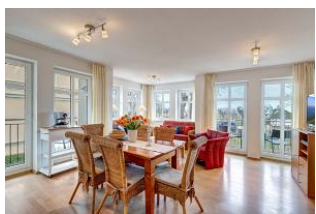
Essplatz und Blick zum Wohnbereich

1. Reihe, direkt an der Strandpromenade mit SEEBLICK und FAHRSTUHL im Haus! Geräumiges und geschmackvoll eingerichtetes 3-Zimmer-Apartment mit moderner guter Ausstattung. Zwei separate Schlafzimmer (eines davon mit 2. Fernseher), Wohnzimmer mit Küchenzeile und Essplatz, Bad mit Wanne und Dusche, Gäste-WC, Balkon zur Seeseite mit ausschnittweisem Seeblick, zus. ein kleiner Balkon neben der Küche. Küchenzeile zusätzlich mit Espressomaschine, Wasserkocher, Eierkocher, Mixer, elektr. Zitruspresse. Die Wohnung verfügt über einen Tiefgaragen-Pkw-Stellplatz. Von der "Villa Aquamarina" aus können Sie das Ortszentrum und die bekannte Ahlbecker Seebücke in ca. 3 Minuten zu Fuß erreichen. Zum Strand sind es 50 m.