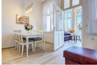
Essbereich und Lesecouch mit Blick zum Wohnbereich in der Veranda