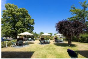
Garten mit Terrassen und Strandkörben (Mai bis September)