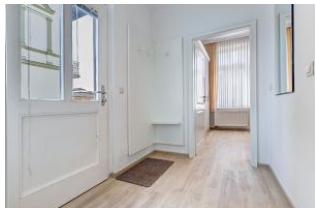
Eingangsfloor mit Blick zum Schlafzimmer