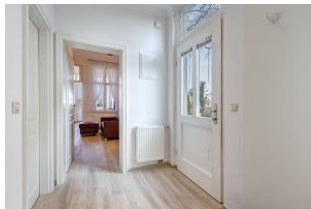
Eingangsfloor mit Blick zum Wohn-/Essbereich