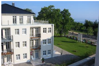
Hausansicht "Villa Aquamarina" von der Südseite (Nachbarhaus)