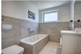
Bad mit Badewanne