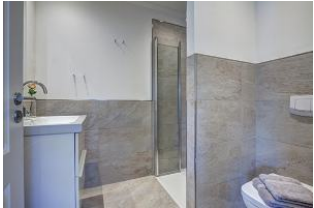
Bad mit Dusche