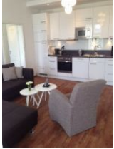
Wohnraum mit offener Küche