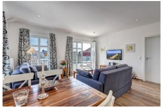
Essplatz mit Blick in den Wohnbereich