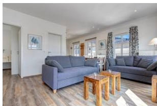
Wohnbereich mit Blick zum Essplatz